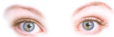
Laserbehandeling voor kijken zonder bril

Let op: parallel aan de afschaffing van de ziektekostenaftrek per 1 januari 2009, vervalt ook de mogelijkheid om ziektekosten die niet door de verzekering vergoed worden, onbelast te laten vergoeden door de werkgever. Ook daarvoor geldt dus: profiteer nu het nog kan!