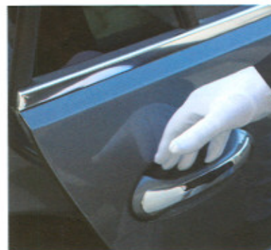
Tip voor dga's

Bij het uitkeren van dividend draagt de bv 15% dividendbelasting af, waarna de dga zelf nog 10% bijbetaalt voor de inkomstenbelasting (totaal: 25% belastingheffing). Het kan dus handig zijn om tijdig een voorlopige aanslag aan te vragen. Zo vermijdt u de heffingsrente en verlaagt u de grondslag voor box 3.