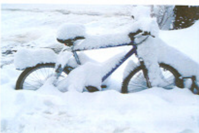
Fiets en bromfiets

Onafhankelijk van het gebruikte vervoermiddel geldt een belastingvrije vergoeding van (nog steeds) 19 cent per kilometer. Dus niet alleen voor auto's, maar ook voor fietsen en brommers.