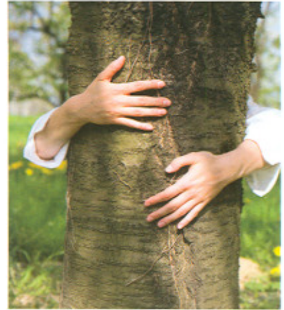
Fiscaalvriendelijke beleggingen: groenfondsen

Waarschuwing: houd er rekening mee dat u bij onnadenkend indienen van een T-biljet juist een aanslag kunt krijgen, in plaats van een teruggave. Laat dus tijdig een proefberekening door ons maken, om te kijken of het zinvol is een T-biljet in te dienen.